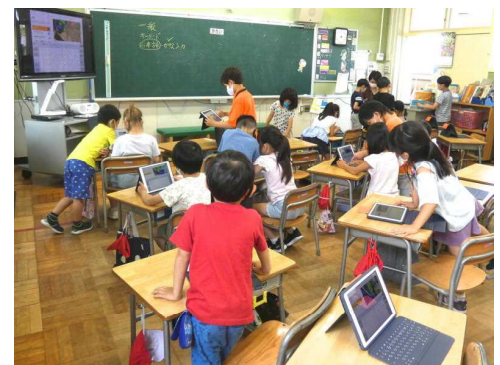
1年生のi P a dを活用した授業

※「新潟市GIGA宣言」では，「 学びを深め，学校生活を豊かにするために活用する 」と「 人が嫌がることや人を傷付けることはしない 」の2つが約束となっている。