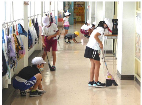
夏休み前特別清掃（7/20）

最後に、記念式典を開催したり、記念誌を発行したりしてきた大きな周年行事についてです。一昨年来、地域の代表者が出席する学校評議員会や校区民交流推進委員会などにおいて、「 大きな周年行事については、25年スパンで実施する 」ということが提案され、了承されています。そのため、次の大きな周年行事は、令和7年度の「75周年」となります。